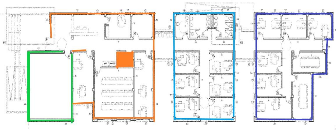
Plano 01 — Zonificación en 4 zonas independientes con unidad exterior propia. Verde: Salón Actos · Naranja: Entrada · Cian: Central · Azul: Final